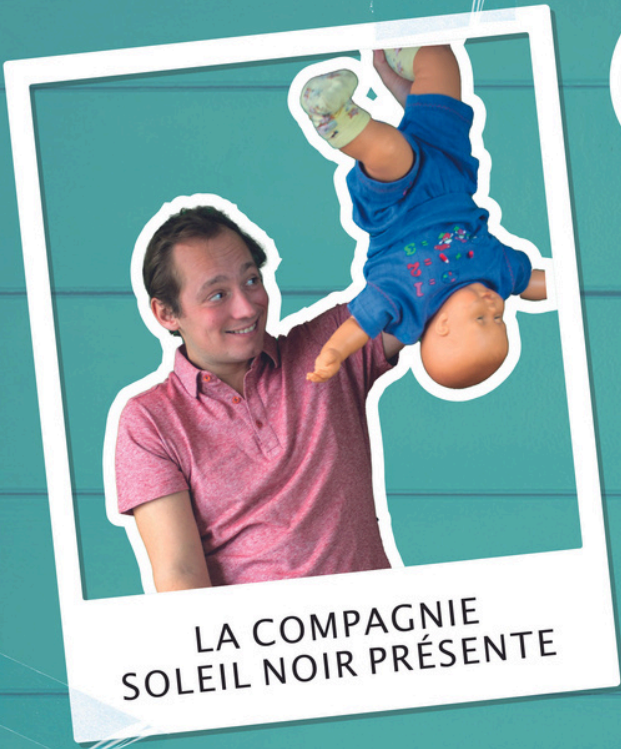
LA COMPAGNIE SOLEIL NOIR PRÉSENTE