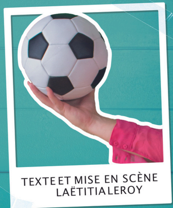
TEXTE ET MISE EN SCÈNE LAËTITIALEROY